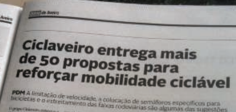
PDM A limitação de velocidade, a colocação de semáforos específicos para bicicletas e o estreitamento das faixas rodoviárias são algumas das sugestões

opção de transporte segura, cómoda, conveniente, desejável e comum em Aveiro, com os diversos benefícios para todos daí provenientes*. As sugestões apresentadas pela comunidade – cidadãos, associações e outras entidades