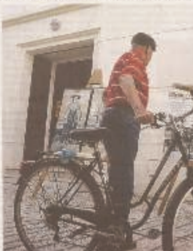
O objectivo passa por, em 2020, a cidade ser exemplo de mobilidade ciclável

Aveiro é ciclável, por si só, não é. A sua estrutura geográfica e condições oferecidas para o uso de bicicletas – falta de ciclovia, falta de pontos de estacionamento e manutenção, concentração de zonas pedonais – são fatores que dificultam o uso da bicicleta no processo de mobilidade partilhada. Mas para quem faz do uso de bicicletas uma opção de transporte seguro, cómoda, conveniente, desejável e comum em Aveiro, com os diversos benefícios para todos daí provenientes*.