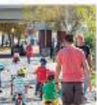
O grupo de cidadãos Ciclaveiro entregou nesta quinta-feira ao Município de Aveiro um conjunto de propostas a serem tidas em conta na revisão do Plano Director Municipal, com o objectivo de

Por António Martins Neves | Janeiro 20 2016